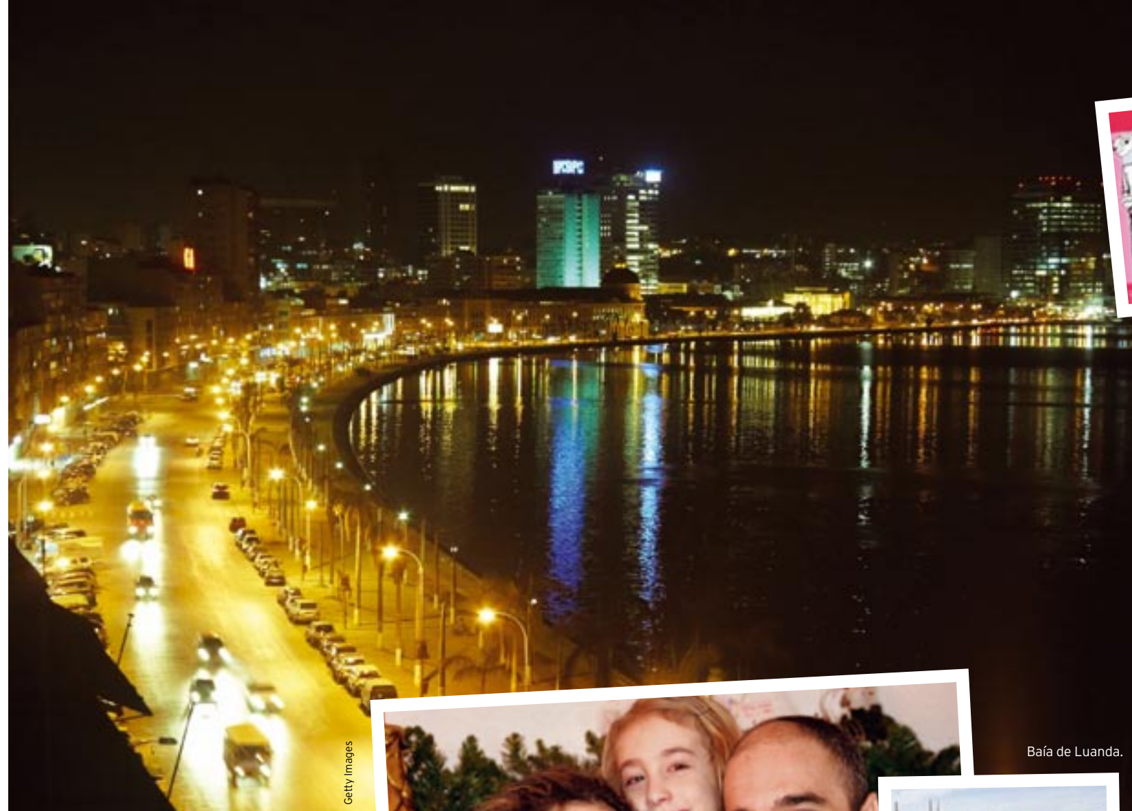
Baía de Luanda.