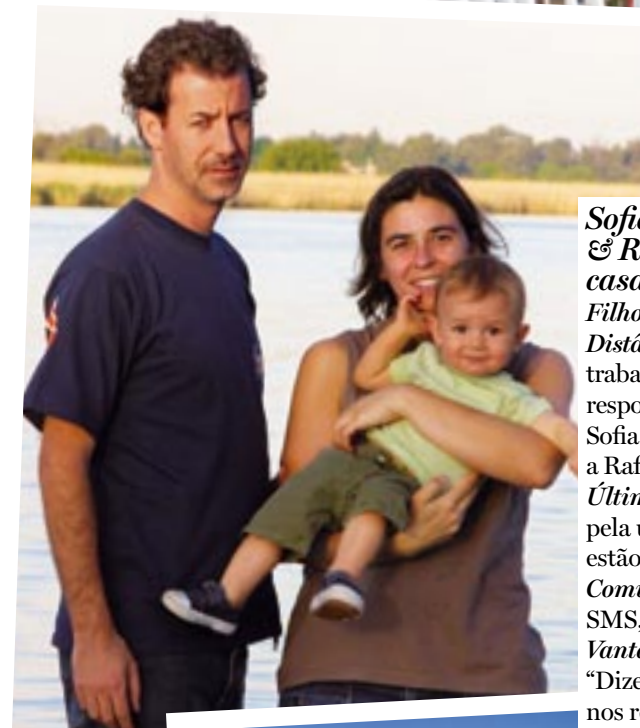
A questão financeira e novas oportunidades profissionais são o motivo principal que leva os casais a arriscarem uma relação à distância.