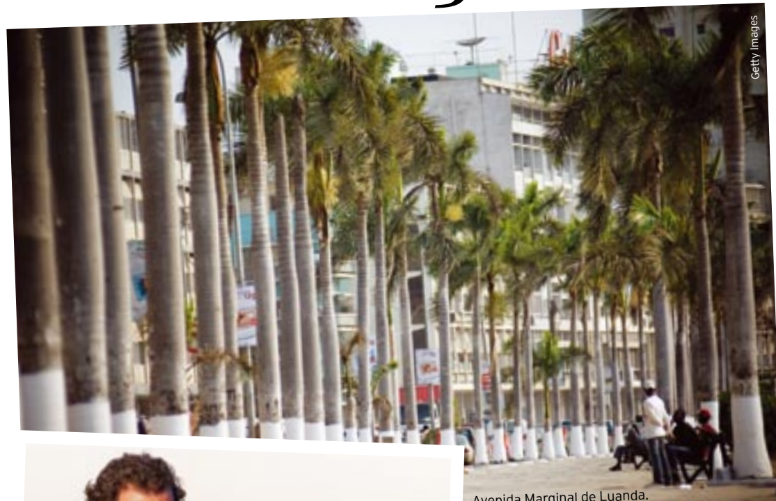
Avenida Marginal de Luanda.

Que o amor não conhece fronteiras já todas sabemos. Mas viver uma relação com alguém que mora a milhares de quilómetros de distância não é tarefa fácil. Por força das circunstâncias – na sua maioria, por questões profissionais e económicas –, há casais separados até por oceanos. Nestes casos, torna-se necessário cuidar ainda mais da relação e a total confiança é requisito obrigatório para que esta resulte. Mas o amor à distância também tem aspectos positivos como, por exemplo, os reencontros super românticos que ainda são antecidos por aquele friozinho na barriga próprio do início das relações. Se está separada ‘à força’ da sua cara-metade, saiba que não está sozinha no mundo, pois existem milhares de casais na mesma situação. Conheça também os segredos para manter a chama acesa... ●